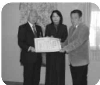
立正佼成会春日部教会幸手支部 様