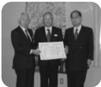
幸手都市ガス(株) 様