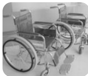
ひまわり歯科医院 様