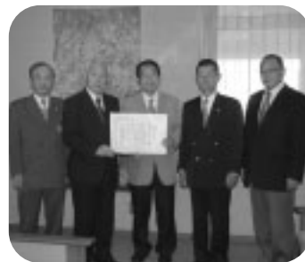
幸手ライオンズクラブ 様