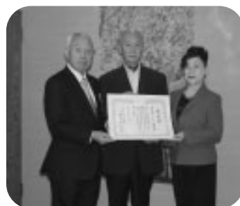
幸手市ソーシャルダンス協会 様