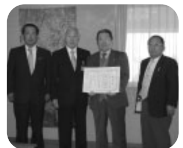
埼玉県トラック協会久喜支部 様