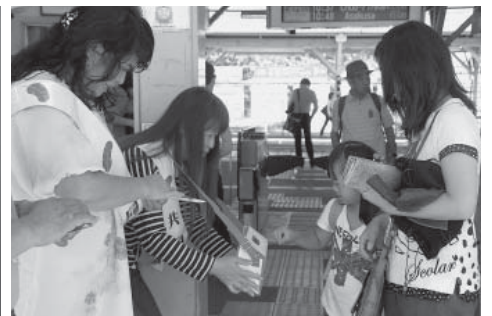
「赤い羽根共同募金」街頭募金活動の様子