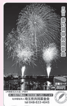
戸田市「戸田橋花火大会」