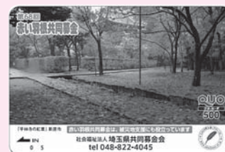
新座市「平林寺の紅葉」