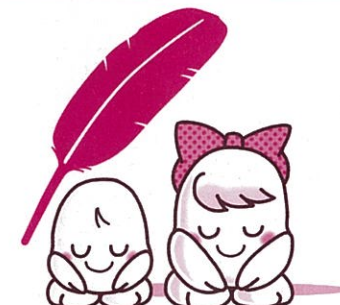
愛ちゃんと希望くん

昨年10月1日から行われました共同募金運動は、皆様の温かいご支援とご協力により多くの募金が寄せられました。この募金は、地域のお年寄りや体の不自由な方、生活に困窮している方や子供たちのために役立てられます。