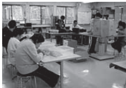
施設利用者の日常生活、社会生活における自立を支援します。