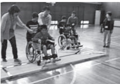
車いす体験等を通じて、小・中学生の思いやりの心を育みます。