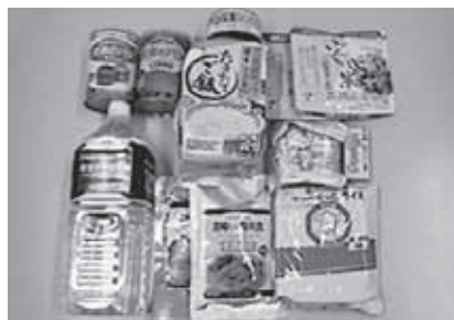
緊急的に食糧を必要とする方へ食糧を無償で提供します。