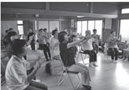
身近な場所で、気軽に触れ合うサロンの活動を支援します。