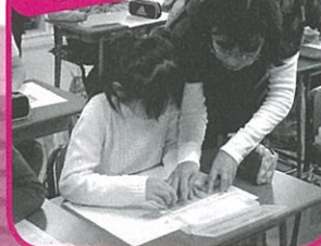
福祉教育・点字体験