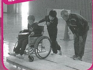
福祉教育・車イス体験