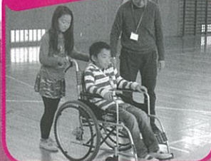
福祉教育・車イス体験