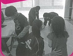
子育て応援まつりのお手伝い